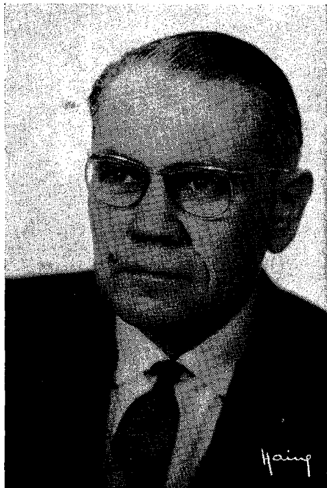
de Belgische minister-staatssecretaris A. de Clerck

Van een minister, evenmin van een minister voor cultuur, althans niet in de openlijke uitoefening van zijn functies, verwacht men literaire geschiedschrijving of het ijken van een gevestigde faam. Men acht hem reeds wijs genoeg als hij zich voor het toekennen van een prijs aansluit bij een verstandige jury. Dit is dan weer geschied bij het toekennen van de zo zeer nodige als begeerde gemeenschappelijk door noord en zuid gestichte Prijs der Nederlandse Letteren. Deze prijs is de anjer (of moet ik zeggen de tulp of de azalea?) in het knoopsgat van onze kulturele integratie. We mogen er trots op zijn dat hij bestaat, we moeten er over waken dat hij onze letteren verder verstrengelt. Ik zou lang willen leven om de lijst na te gaan van vele dezer prijzen. Wat een glanzende ketting Nederlands genie zouden wij te zien krijgen. Reeds de eerste schakels zijn benijdenswaardig sterk: Teirlinck, Roland Holst, Streuvels; vandaag Bloem. Zij die tot nog toe werden bekroond kunnen beschouwd worden als onze rijpste talenten. Ik weiger in de volgorde een regelmaat te zien van afwisseling. Deze prijs is geen staplied: zuid-noord, zuid-noord Ik beken ook openlijk dat volgens mij de prijs niet per se moet toegekend worden aan vaste waarden, gepaard met eerbied voor de ouderdom. Wel wordt de prijs toegekend voor het gehele oeuvre van een auteur maar wie belet